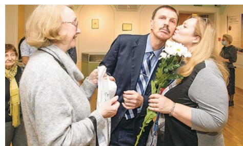
Теряя зрение, люди по-прежнему остаются яркими, самодостаточными личностями, чутко воспринимающими мир