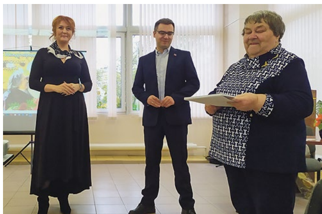
Теплая и творческая атмосфера царил в этот день в зале библиотеки имени Фрунзе