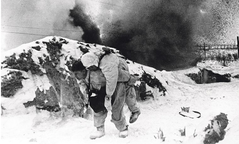
На Пулковских высотах.