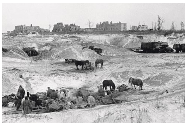
Северный склон Пулковских высот.