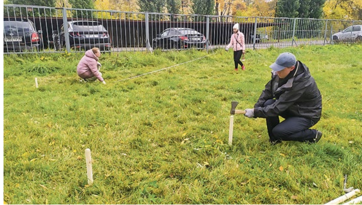
Исследователи планируют вести наблюдение за газоном в течение нескольких лет

Первый участок вообще не будет скашиваться, здесь будет происходить естественная смена растений, по-научному – «сукцессия». Второй – луговой участок – будет скошен один раз, в конце сезона, а с весны до осени будем любоваться цветением на нем городских дичков одуванчиков, сурепки, сныти, репейника. Третий участок сносят в строгом