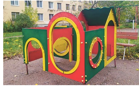
Неудовлетворительное состояние фанерных элементов

В октябре муниципалитет заключил контракт на демонтаж аварийного оборудования с муниципальных площадок по девяти адресам. Аварийное игровое и спортивное оборудование частично будет заменено на новое, по некоторым адресам появятся новые современные площадки.