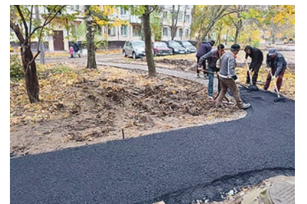
Асфальтирование дорожек на Софийской улице, 35/4