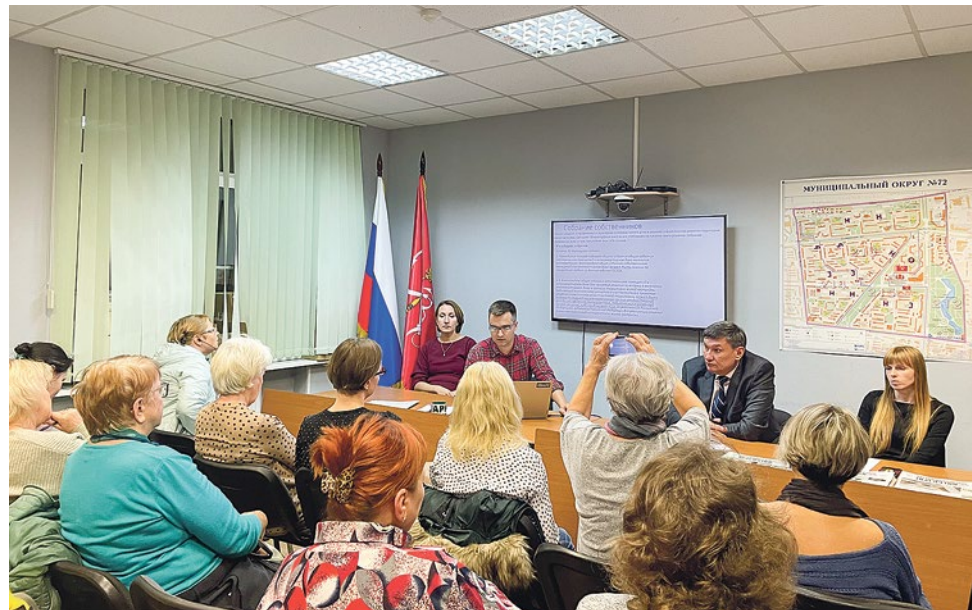
На первом собрании Общественного штаба по КРТ затронули наиболее важные вопросы

Принятый в невероятной и неоправданной спешке Закон № 444-59 вызвал бурю негодования жителей города, вследствие чего губернатор Санкт-Петербурга Александр Беглов принял решение о приостановке некоторых положений закона до 1 января 2024 года. Речь идет о трех статьях: 14-3, 14-4 и 14-5, в них говорится о порядке определения территории, подпадающей