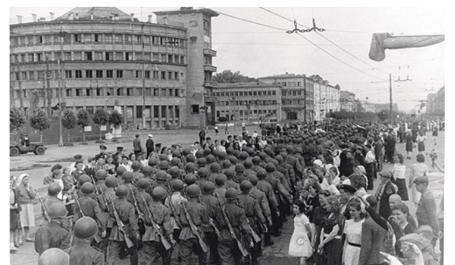
Парад победы на Международном проспекте, 1945 год.