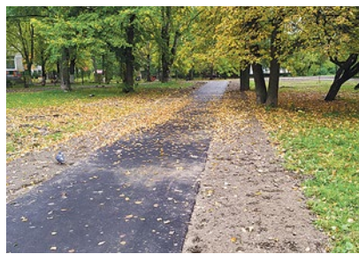
Ремонт дорожек на улице Турку, 22/6