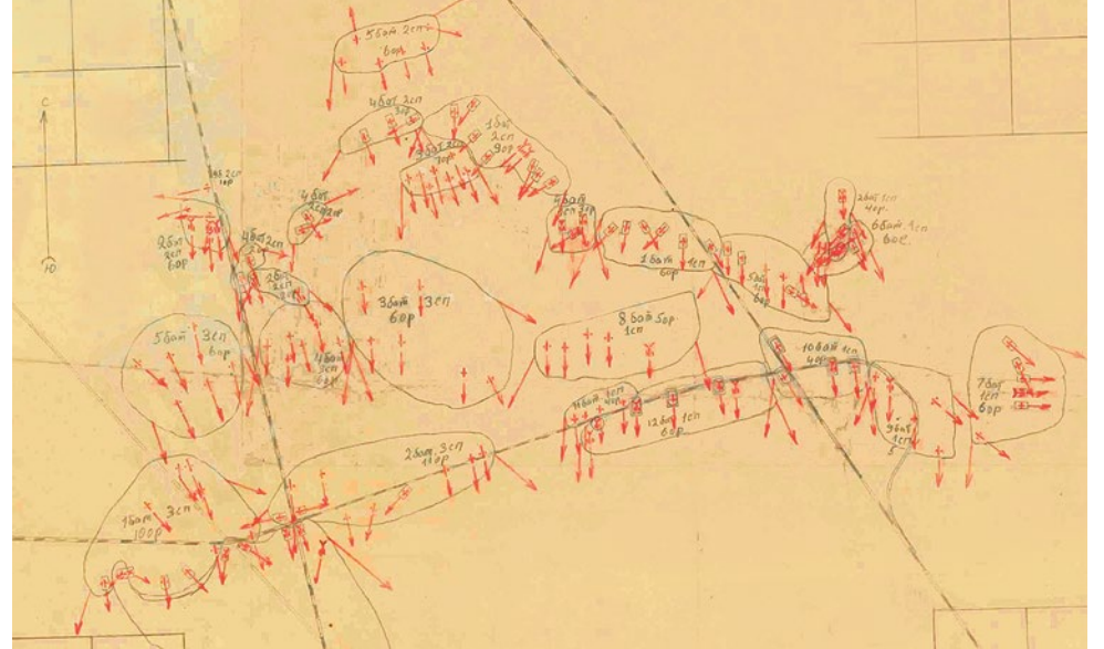
Позиции противотанковой обороны в Купчино. Схема. Октябрь 1941 года