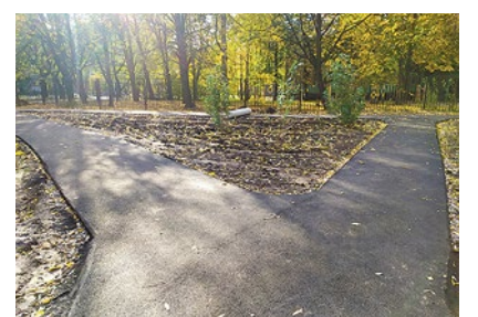
Асфальтирование дорожек на Софийской улице, 39/3